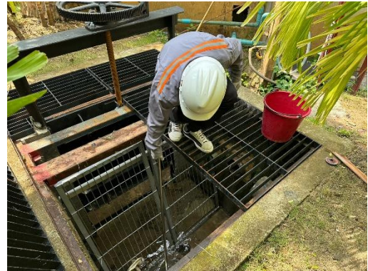
รูปที่ 3-5 ควบคุมไม่ให้มีปริมาณน้ำไหลและน้ำโคลนบนพื้นที่ก่อสร้างที่จะเกิดความผิดปกติ