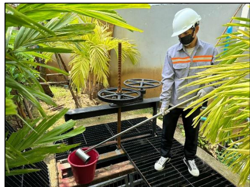
รูปที่ 3-12 บ่อพักน้ำทิ้งที่ผ่านการบำบัด