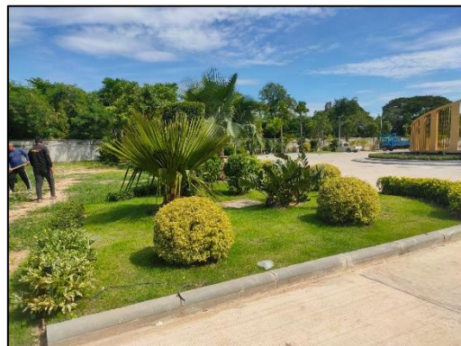
รูปที่ 3-6 พื้นที่โครงการไม่เก็บกองวัสดุที่อาจก่อให้เกิดฝุ่นในบริเวณพื้นที่ก่อสร้าง