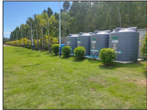
รูปที่ 3-11 จัดให้มีถังสำรองน้ำใช้ให้เพียงพอกับความต้องการ