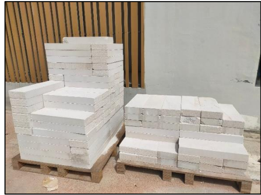
รูปที่ 3-4 ตัวอย่างระบบสำเร็จรูปหรือกึ่งสำเร็จรูป ให้มีการหล่อคอนกรีตในพื้นที่ก่อสร้างน้อยที่สุด