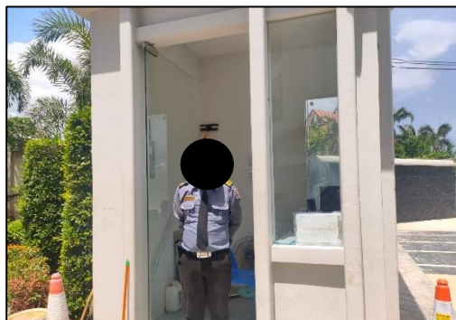
รูปที่ 3-3 เจ้าหน้าที่ที่เกี่ยวข้องคอยรับเรื่องร้องเรียนที่อาจเกิดจากการก่อสร้าง