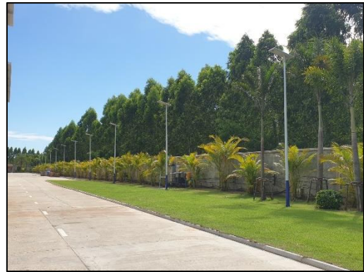
รูปที่ 3-2 พื้นที่โครงการมีความเป็นระเบียบเรียบร้อย