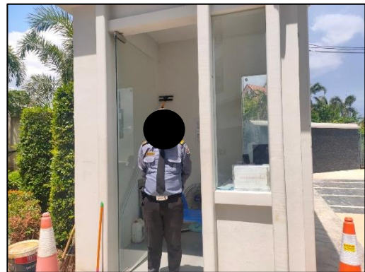
รูปที่ 3-13 จัดให้มียามรักษาความปลอดภัยตลอด 24 ชั่วโมง