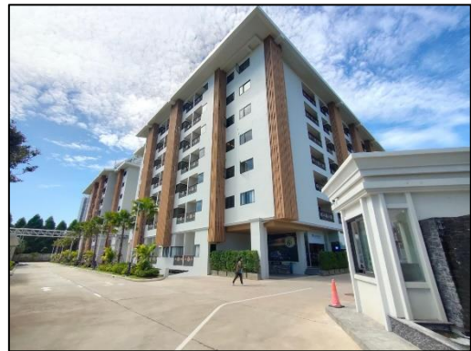
รูปที่ 3-9 ผนังอาคารจากพื้นจนถึงเพดานชั้นก่อสร้าง ทำหน้าที่เป็นกำแพงกันเสียง