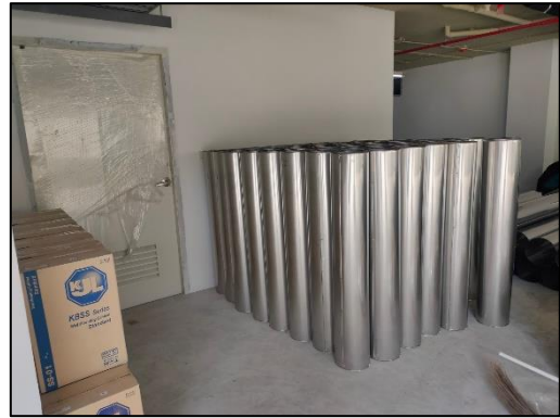
รูปที่ 3-1 จัดวางแผนและจัดระเบียบการเก็บกองวัสดุก่อสร้างเป็นสัดส่วน