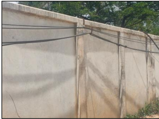
รูปที่ 3-8 ใช้รั้วคอนกรีตทำหน้าที่เสมือนเป็นกำแพงกันเสียง ติดตั้งที่แนวเขตที่ดินและใช้เป็นรั้วโดยรอบโครงการ